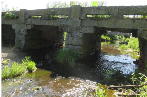
Harrströmin kivisillat rakennettu 1898