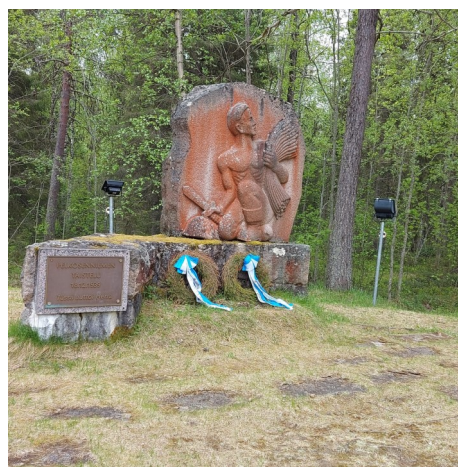
Pelkosenniemen taistelun muistomerkki