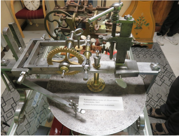
Keervärkki eli ratasleikkuri vuodelta 1815