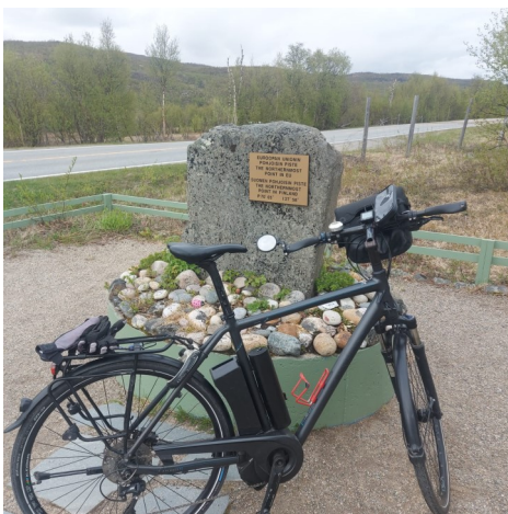
EU:n pohjoisin piste