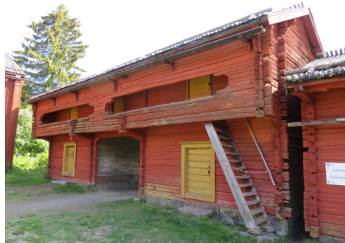
Vanha aitta Stundars-museon alueella