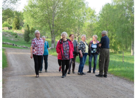
Kesäkuussa Taival-Tuvalla vierailivat Salon Sydänyhdistys ja Salon Näkövammaiset.